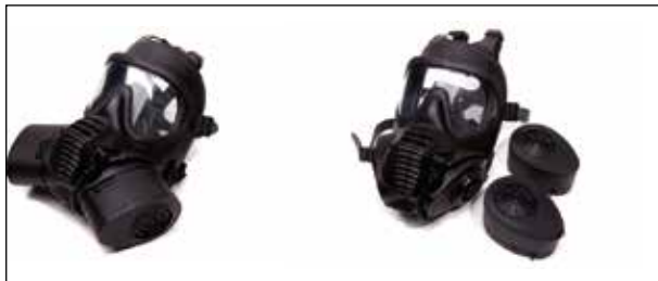
Рисунок 1 – Респиратор GSR

ставляет интерес респиратор GSR (Gas Mask and Respirator), поступающий на снабжение военнослужащих Великобритании (рисунок 1) 5 .