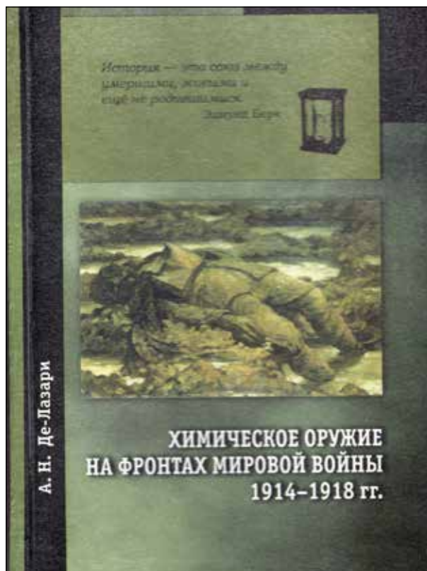
«Химическое оружие на фронтах Мировой войны 1914–1918 гг.» Издание 2008 года

Краткий исторический очерк развития химического оружия по опыту мировой войны 1914–1918 гг. М.: 1934.