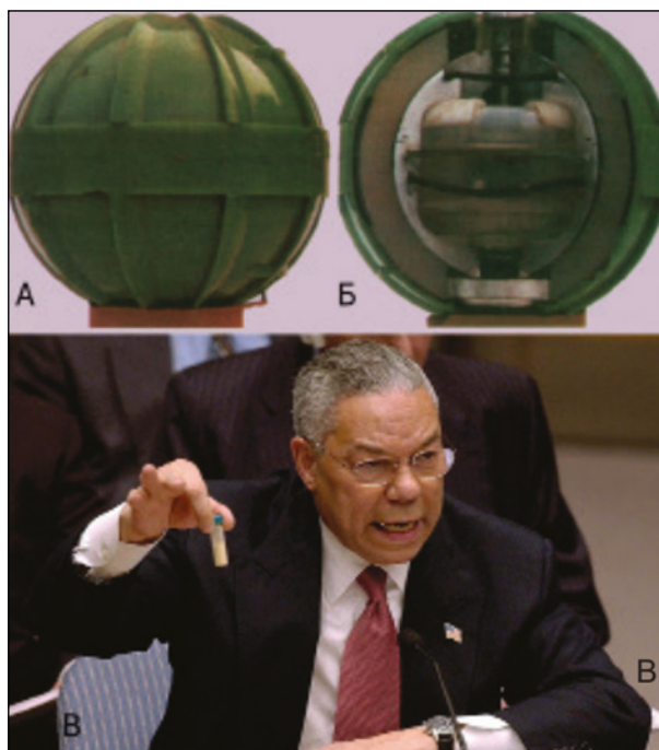
Рисунок 2 – Биологическое оружие и его мистификация. А и Б – субэлемент E-120 кассетной биологической бомбы. Разработан в США в конце 1960-х гг., т.е. перед официальным окончанием программы по созданию БО в ноябре 1969 г. Оснащен барометрическим взрывателем, позволяющим осуществлять его подрыв на заданной высоте (А – внешний вид бомбы. Б – поперечный разрез бомбы). Аналогичный боеприпас с химическим снаряжением обозначался как M-139 [6]. В – мистификация темы биологического оружия. Колин Пауэлл на заседании Совета Безопасности ООН 5 февраля 2003 г. (фотография с ресурса https://www.ustkut24.ru/?p=38667 ; дата обращения: 10.12.2020)

Третья обзорная Конференция проходила в Женеве с 9 по 27 сентября 1991 г. Международная ситуация к этому времени упростилась в связи с окончанием, как тогда считали, «холодной войны». Однако осложнилась проблема биологического оружия. В 1970-х гг. появилась технология генной инженерии. У апологетов биологического оружия она породила надежды на быстрое создание генетически измененных вариантов известных патогенов (более устойчивых к факторам внешней среды и антибиотикам, с измененным антигенным составом, более вирулентных и контагиозных и т.д.). Успешные переговоры по различным соглашениям о контроле над вооружениями укрепили уверенность в том, что сложные вопросы контроля над биологическим оружием могут быть доведены до приемлемого решения [22]. В 1989 г. в Великобритании появился еще один советский перебежчик, показаниями которого по военно-биологическим программам, как предполагалось, можно было сделать СССР более стоворчивым – бывший директор