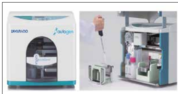
Рисунок 1 – Система для выделения нуклеиновых кислот «QuickGene-810»

Японская компания «Kurabo» выпускает серию приборов для очистки нуклеиновых кислот, различающихся как производительностью,