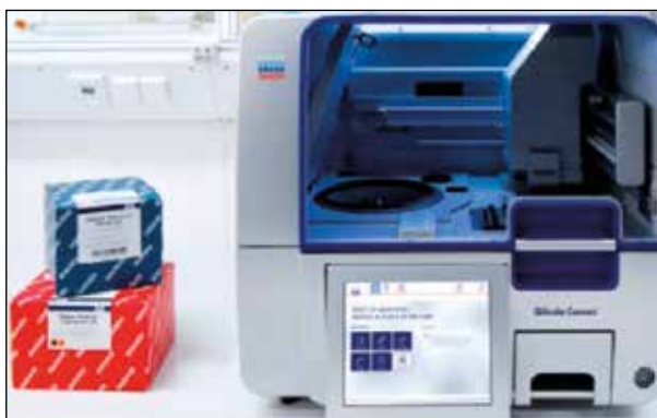
Рисунок 1 – Прибор для автоматического выделения нуклеиновых кислот «QIACube»¹