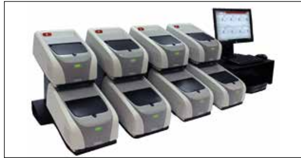
Рисунок 7 – Станция «BioFire FilmArray» (8 блоков) 1

Для своей работы данная система использует одноразовые проприетарные картриджи, которые содержат все необходимые химические реагенты как для подготовки образцов проб, так и для постановки ПЦР. Конструкция картриджей позволяет исключить возможность как контаминации реагентов, так и случайного разбрызгивания содержимого в окружающую среду. Лизис осуществляется ультразвуковым методом. Реакционная смесь перемещается по камерам картриджа, в которых происходят очистка и концентрирование нуклеиновых кислот, с помощью системы микротрубочек и насосов. На завершающем этапе в реакционной камере выполняется ПЦР-РВ. Многоканальная оптика и система светофильтров обеспечивает возможность мультиплексирования. Производительность составляет от 30 минут до 2 часов в зависимости от анализируемой пробы.