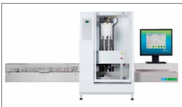
Рисунок 5 – Система для выделения нуклеиновых кислот «HK Chemagic MSM I Instrument» 1