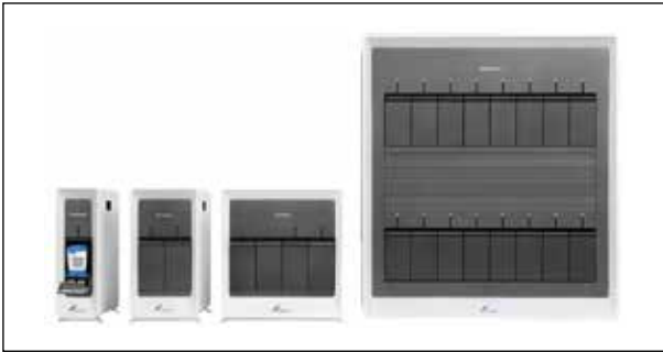
Рисунок 6 – Оборудование серии «GeneXpert» 1

1 URL: https://www.cepheid.com/Site%20Images/Systems/product_GXsuite%20%282%29.png (дата обращения: 05.07.2020)