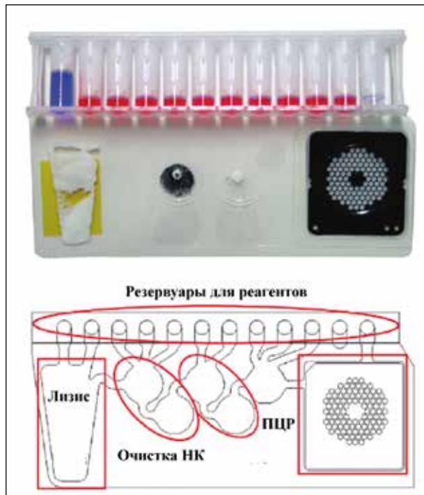
Рисунок 8 – Общий вид и схема функционального предназначения отдельных элементов реакционного пакета «FilmArray» [40]

Непосредственно перед использованием растворяют лиофилизированные реагенты, на-