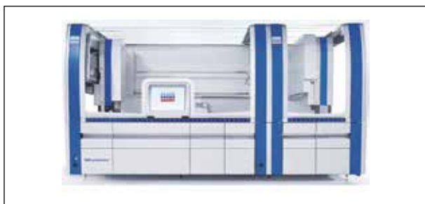
Рисунок 4 – Автоматизированная станция выделения нуклеиновых кислот «QIASymphony» 1