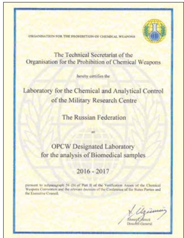
Рисунок 4 — Сертификат международной аккредитации лаборатории на право анализа биомедицинских проб

технологичным аналитическим оборудованием, включающим несколько газовых хроматографов с одноквадрупольными масс-детекторами, газовые и жидкостные