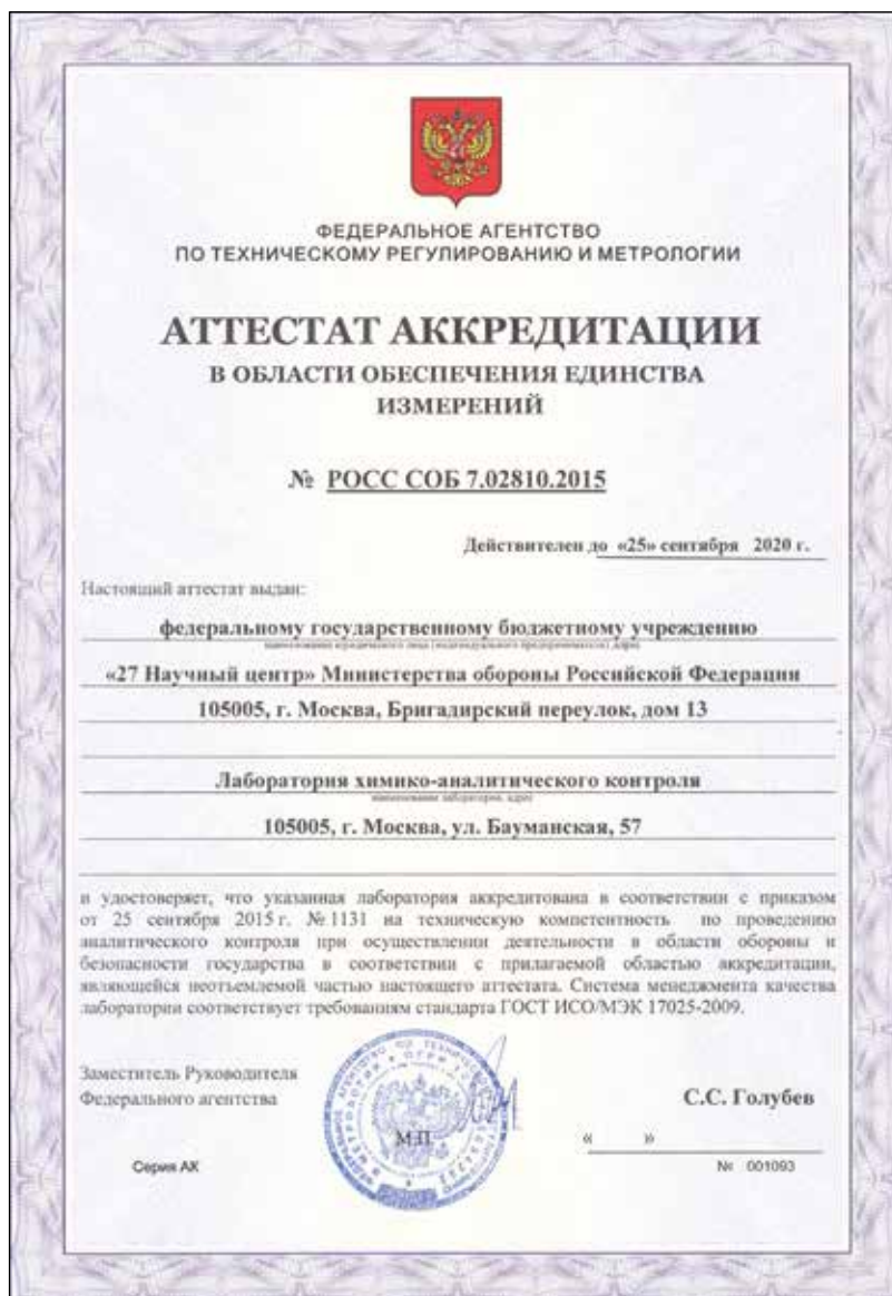
Рисунок 1 — Аттестат национальной аккредитации лаборатории

По завершении подготовительного этапа и вступления в силу КХО, Организацией по запрещению химического оружия (ОЗХО) была начата реализация программы создания сети специализированных национальных лабораторий и их аккредитации. Для этого, начиная с 1996 г., под эгидой ОЗХО на регулярной основе