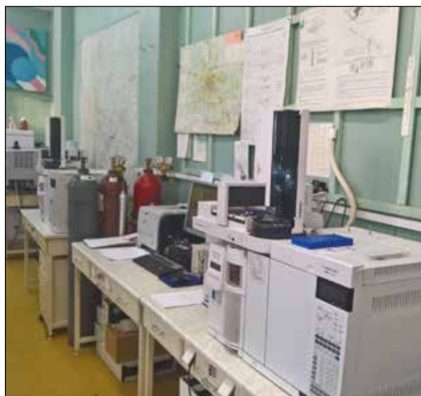
Рисунок 6 — Аппаратный зал