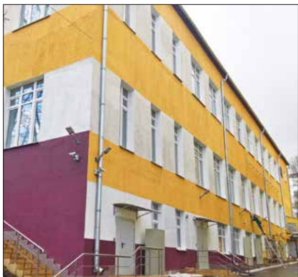
Рисунок 5 — Здание лаборатории

За 25-летний период сотрудники Лаборатории химико-аналитического контроля 27 НЦ МО РФ успешно решили большое количество задач, связанных с анализом сложных по составу объектов при расследовании предполагаемых фактов применения химического оружия, а также проб, доставленных с мест захоронения оставленного химического оружия и с территорий бывших объектов по его производству. Лаборатория выполняет определение высокотоксичных веществ в различных аварийных ситуациях, а также в объектах криминального характера и продолжает функционировать в интересах обеспечения химической безопасности Российской Федерации.